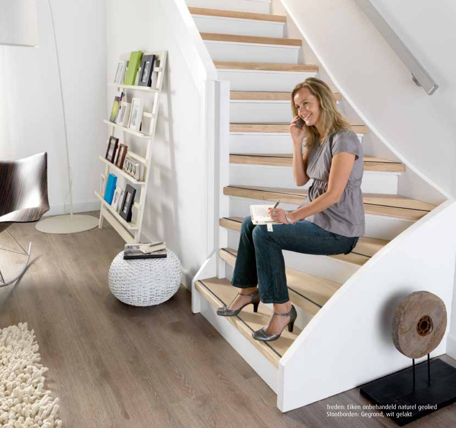
Treden: Eiken onbehandeld naturel geolied Stootborden: Gegrond, wit gelakt