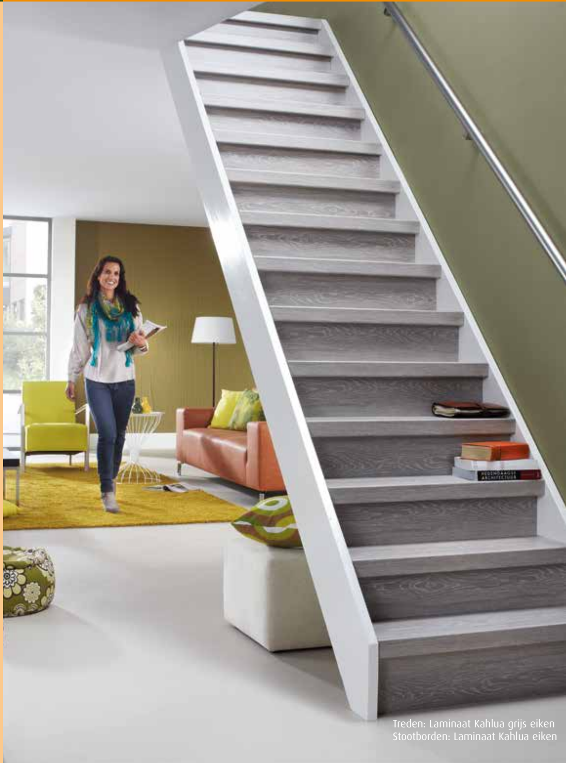
Treden: Laminaat Kahlua grijs eiken Stootborden: Laminaat Kahlua eiken

Is je trap niet meer zoals hij geweest is? Of wil je je oude trap een compleet nieuwe uitstraling geven? Dit kan nu met het CanDo traprenovatie systeem. Betaalbaar en eenvoudig.