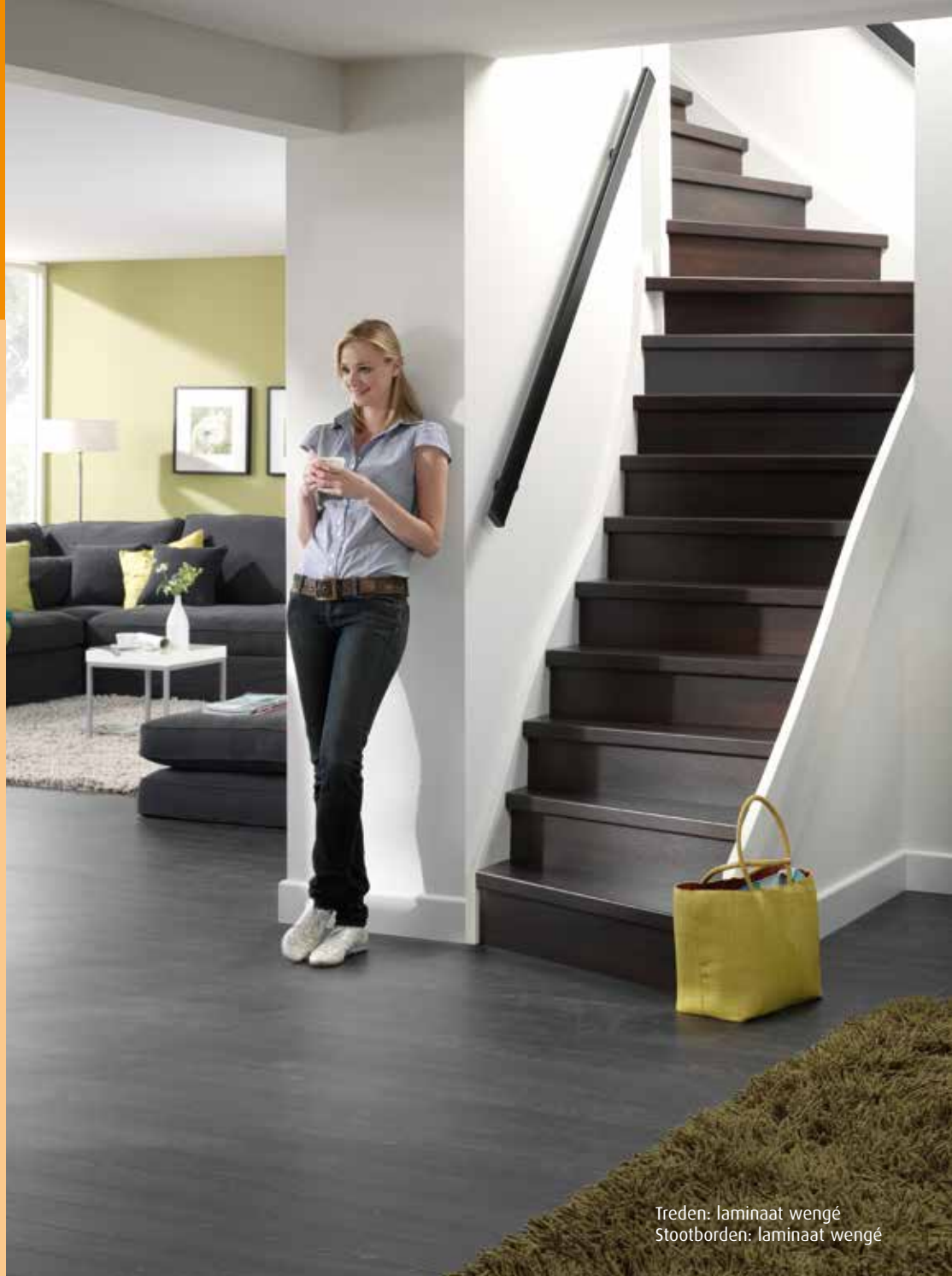
Treden: laminaat wengé Stootborden: laminaat wengé