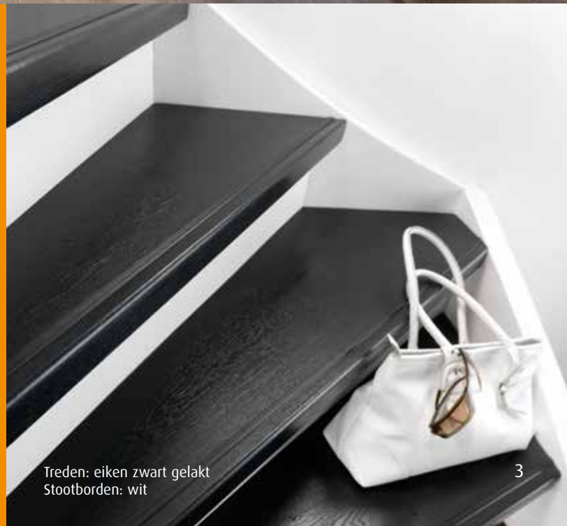
Treden: eiken zwart gelakt Stootborden: wit