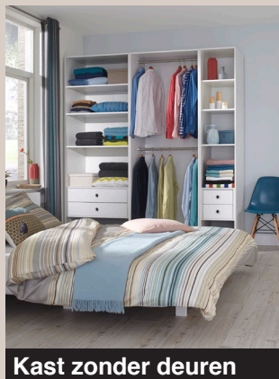
Kast zonder deuren

Snel en eenvoudig een kast in elkaar zetten? Dat kan in een handomdraai met het nieuwe montagesysteem Smartbox! Met de eenvoudige klikverbinding kunt u zelf uw ideale kast samenstellen en volledig zonder gereedschap monteren.