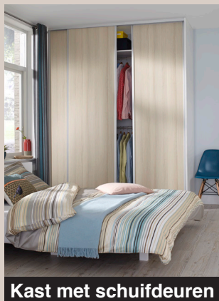
Kast met schuifdeuren